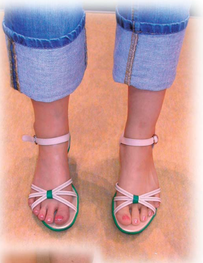
(復元後) ※向かって左側が義足

完全オーダーメイドな為、ヒールの高さに合わせて製作することもできます。サンダルを履いたり、おしゃれの幅も広がります。