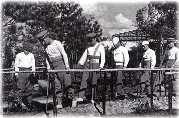
義足での歩行訓練 (『臨時東京第三陸軍病院写真帖』より)

本展は、戦争によって足に障がいを負い、“立つ”“歩く”という行為を義足とともに歩んで来られた戦傷病者のパーソナルヒストリーを見つめるものです。義足は、どのような経緯で作られ、戦傷病者の足となっていたのか、使用者それぞれの歩みと共に振り返ります。