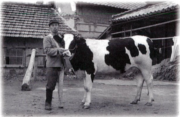
牛と共に義足で働く (寄贈写真より)